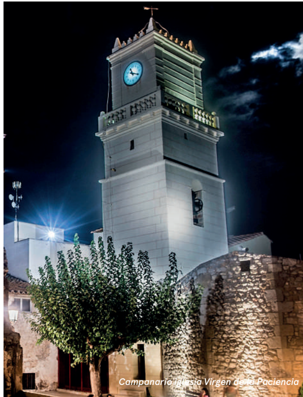
Campanario Iglesia Virgen de la Paciencia

Entre los monumentos más emblemáticos que han previvido al paso del tiempo puedes visitar la Torre del Rey . Ferran I de Antequera mandó construir en la costa la Torre defensiva del Rey que más tarde reformaría el Conde de Cervellón dándole su configuración actual. Posteriormente sería comprada por Felipe II, motivo por el cual pasó a denominarse Torre del Rey .