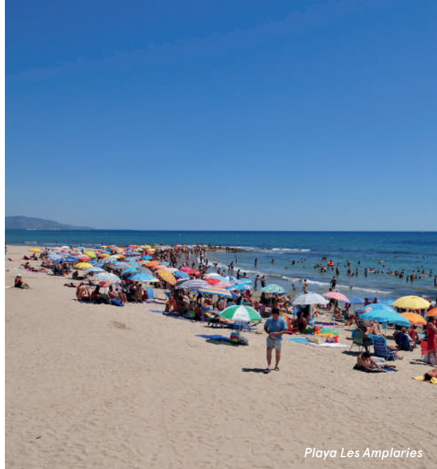
Playa Les Amplaries