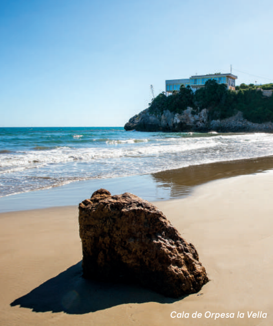
Cala de Orpesa la Vella