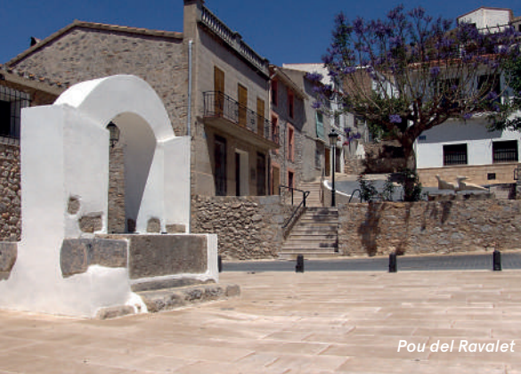
Pou del Ravalet

Junto a la Torre del Rey se construye en el siglo XIX El Faro , pieza muy interesante de ingeniería pública de la época.