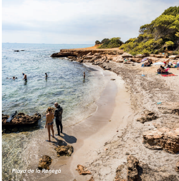
Playa de la Renegà

La Renegà es un conjunto de pequeñas calas de rocas y arena gruesa, esculpidas a golpe de mar y viento, rodeada de una vegetación enrevesada que la convierte en un lugar